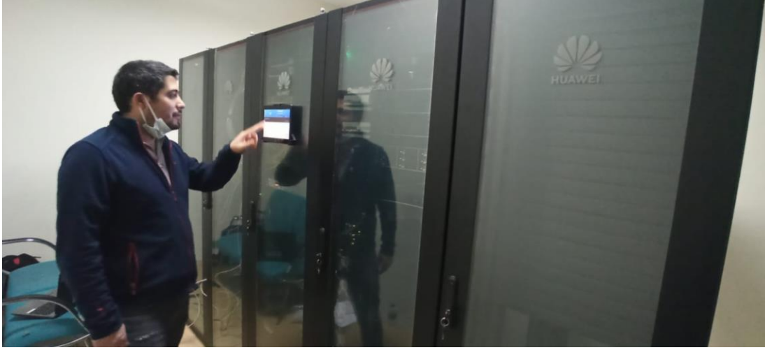
Resim 1. Veri Merkezi ve İlgili Sunucu kabinleri ve Sunucular